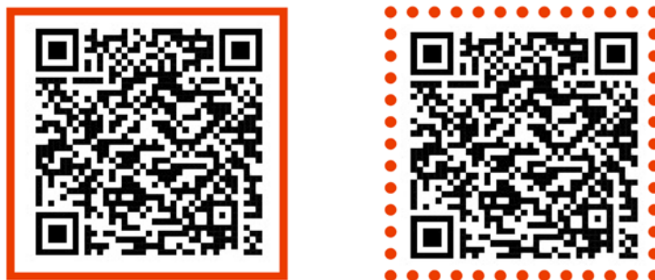
Figura 1. Ejemplos de QR con distintos contornos