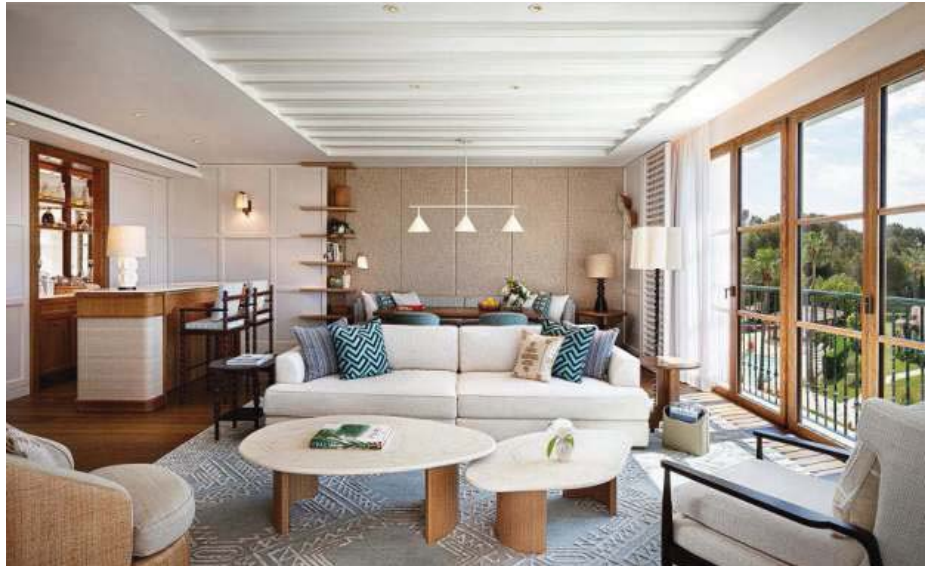
SUITE PENTHOUSE. Tiene tres habitaciones y zona de estar que se asoman a los jardines y el Mediterráneo.