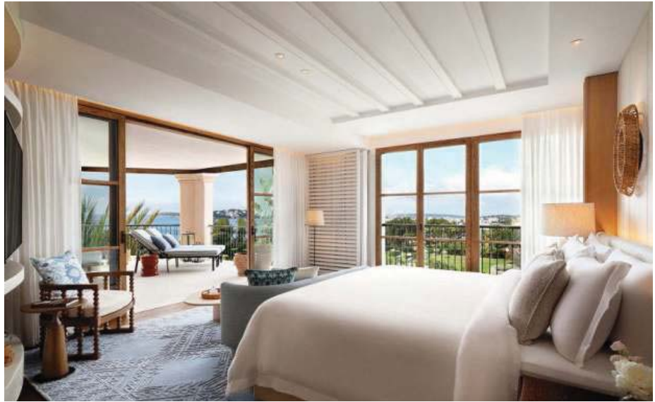
SUITE ASTOR. La habitación y parte de la terraza, de 154 metros cuadrados.