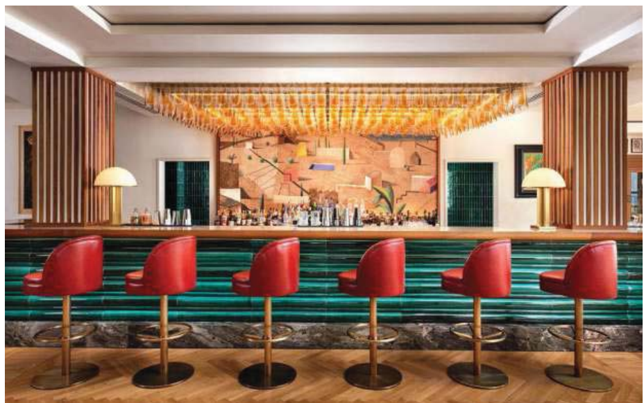
VIDA SOCIAL. El bar, con firma de Lázaro Rosa-Violán, está hecho al estilo de lobby bar de arte.