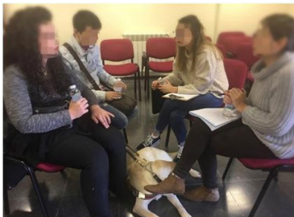
Figura 2. Gran grupo de trabajo