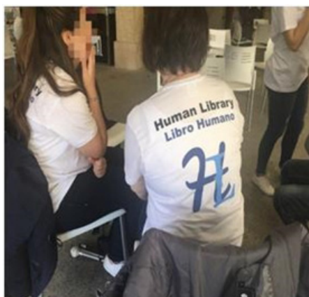
Figura 11. Camiseta con el logo de la Biblioteca Humana

La chapa tiene fondo blanco y, sobre ella, aparece el logo del evento, y en la parte inferior las palabras «Human Library».