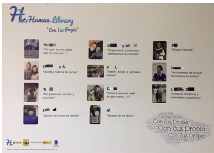
Figura 5. Panel de relatores