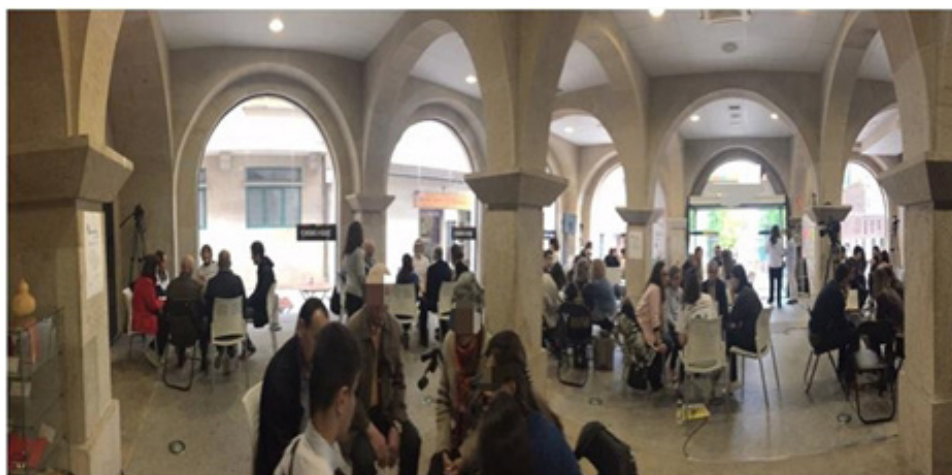
Figura 6. Panorámica de la Biblioteca Humana

Cada libro humano, identificado por su camiseta (con el título de su libro), se sienta en una silla colocada en círculo con otras seis o siete sillas. En la paleta de su silla hay un micrófono (para grabar las conversaciones) y un cartel en el que aparece, a la izquierda, su foto, y, a la derecha, el nombre del relator y el título y resumen de su libro. La Figura 7 muestra un libro humano en un rincón de la biblioteca humana y la Figura 8 otro libro en un momento de su relato.